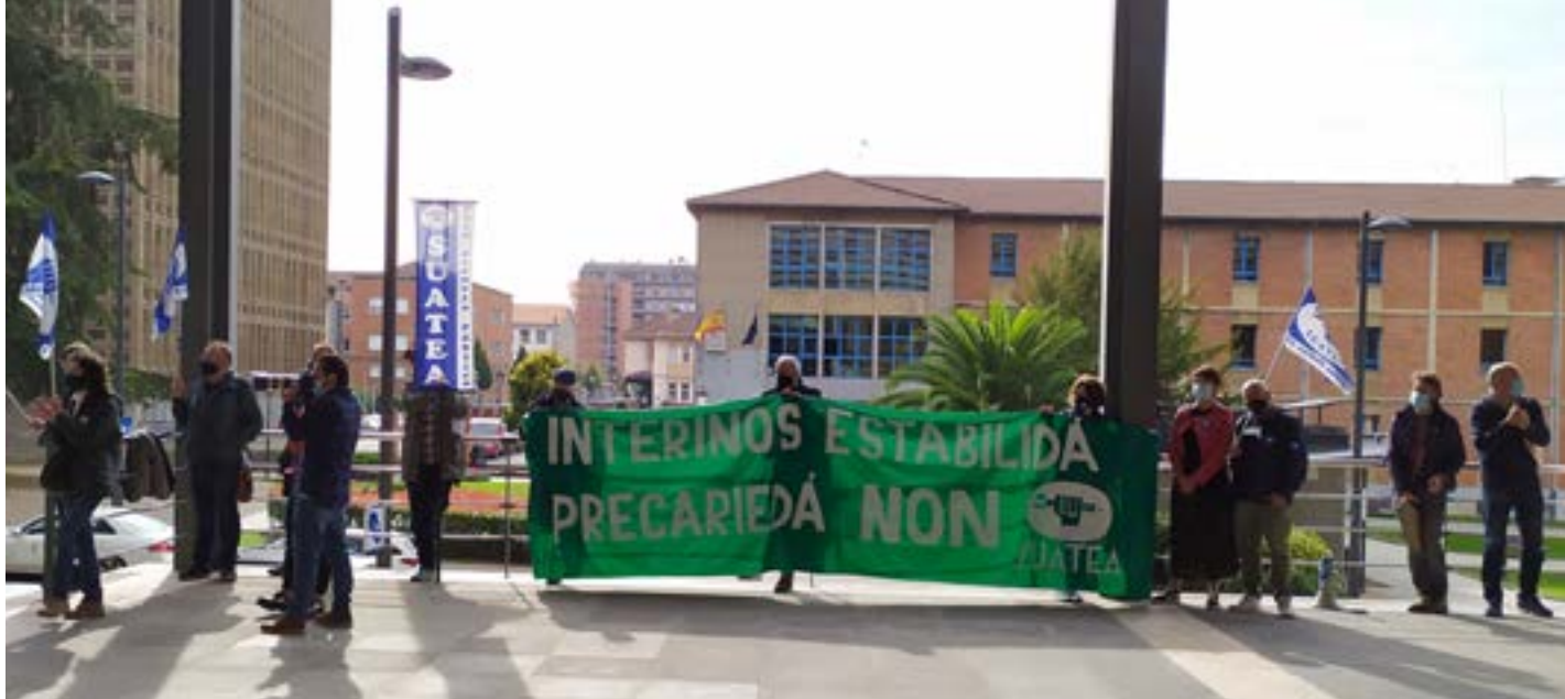
Movilizaciones del profesóru interín

pendiente de cualquier consideración relativa al calter abusivu de la utilización de contratos talos de duración determinada. Esto ye, los procesos d'estabilización que permiten la participación del personal que nun tuvo una rrelación contractual abusiva (interinidá de llarga duración) cola Alministración nun cumplen la directiva europea.