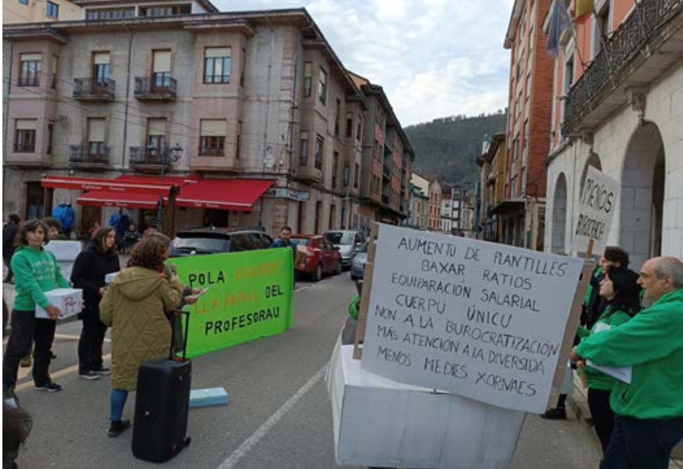
Docentes coles reivindicaciones a la Consejería

Too ello nun contestu nel que sobren les escuses y falten les acciones, según manifestó en nota de prensa l'Asamblea de Profesoráu: “La escuela pública asturiana lleva años sometida a axustes cola sida de la crisis económica, la racionalización del gastu o la baxada de la natalidá”, lo que pal colectivu nun son más que “coarctaes” pa seguir manteniendo la inversión n'educación n'Asturies, que supón el 3,1% del PIB autonómicu, perbaxo de la media estatal, qu'en 2021 foi del 4,1%, y también de la media de los países de la OCDE, que ta penriba del 5%. “Una cifra, el 3,1% asturianu, que ta bien lloñe d'algamar la reivindicación del 7% d'inversión pa Educación”, denunció l'Asamblea.