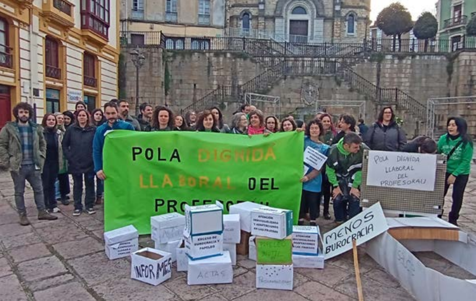
Movilizaciones del profesoráu interín