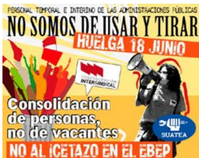
Cartel de les movilizaciones en defensa del profesóru interín

fiximos posible l'accesu per concursu de méritos, ensin tener qu'opositar. Inda y too, el boicot de dalgunos partíos políticos y sindicatos a los procesos d'estabilización del personal docente quedó patente tanto na Ufierta d'Emplegu Públicu del Gobiernu del Principáu d'Asturies, de 27 de mayu de 2022, como nel RD 270/2022, de 12 d'abril, de modificación del reglamentu d'accesu a la función pública docente. Too ello obligómos a utilizar, tamién, la vía xudicial y a presentar dos demandes: una dende SUATEA contra la OPE d'estabilización asturiana y otra dende los STE contra'l RD 270/2022. Dambes demandes desestimáronse. La primera pol Tribunal Superior de Xusticia d'Asturias y la segunda pol Tribunal Supremu español.