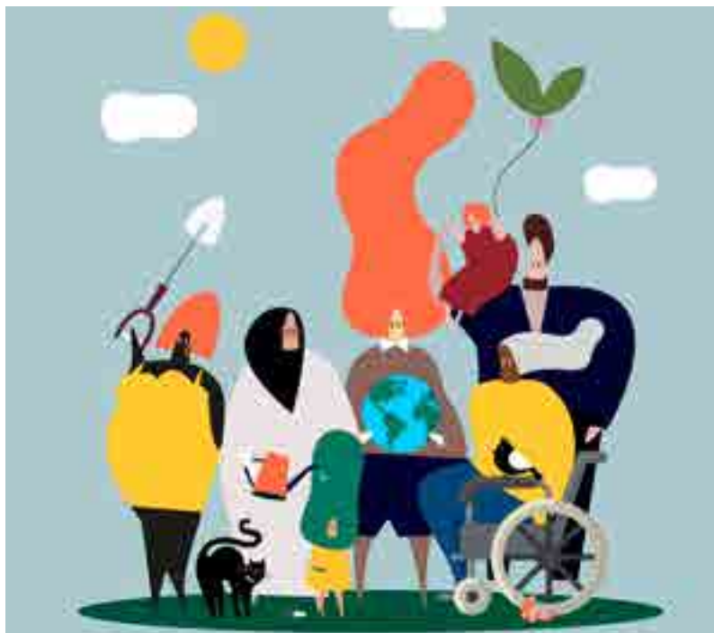
Diseñado por Freepik

A esta conclusión yá se llegara nel alcuerdu de plantiyes del 2001 nel que s'afitaba qu'en cada centru debiere haber 1 profesional de PT a xornada completa ya, nel so casu, compartíu con un máximu de 2 centros; tamién 1 profesional d'AL a xornada completa compartíu ente, máximu, 3 centros. Asina lo recordemos nes últimes xuntes cola Consejería que, nun primer momentu nun yera a acordase d'alcuerdu talu. Nel últimu conceyu, al qu'acudimos col documentu, falaben "d'una redaición ambigua que da a pensar que les profesionales podíen tar tamién a xornada parcial". Nun esiste ambigüedá tala yá que nel añu 2001 nun esistía la contratación a xornada parcial, situación bien diferente a la d'anguaño onde cuasi'l 16% de les PT ya'l 26%