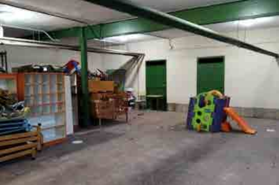
Estado a 8 de enero, en el que se encontraba el nuevo patio del CP Virgen de las Mareas.