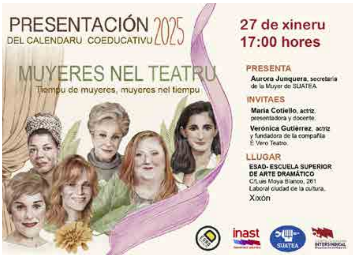
Cartel de la presentación del calendario.

cional son merecedoras de salir en los libros de texto, así decían al incluir a Marie Curie; mientras que el 90% eran referencias masculinas que no necesitaban ser excepcionalmente buenos.